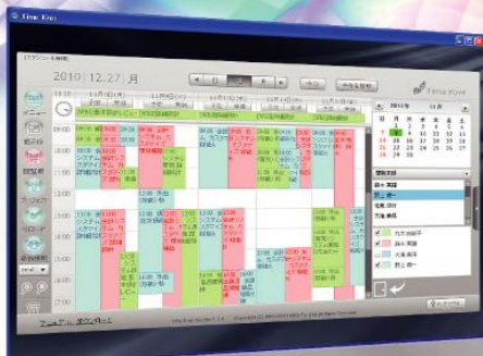
スケジュール管理